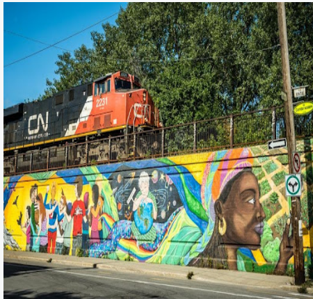
Olivier / Les voix du Quartier / QC

« Je suis le co-animateur d'une future série-web, "Les Voix du Quartier" qui engage et encourage la présence de la diversité jeunesse de Montréal et ses environs, Nous sommes deux jeunes de milieux différents qui se rejoignent par leur passion pour les gens, la communication et l'amour en envers la diversité montréalaise. Notre projet est un plateau de tournage inclusif qui met de l'avant les jeunes de la Montréal et ses environs. Un endroit où la vraie nature des interviewés ainsi que leur passion feront ressortir la beauté qui se cache derrière cette belle communauté de jeunes du grand Montréal.' » Par Olivier, Co-animateur.